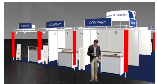
Pavillon « France Laser et Procédés », 200m 2